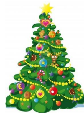
NATALE E LE SUE TRADIZIONI