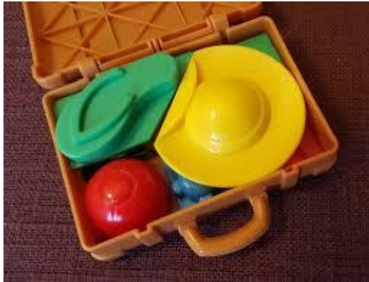
LA VALIGIA DEI COLORI

STORIA: MACCHIA ROSSA E IL VIAGGIO NEL MONDO DEI COLORI